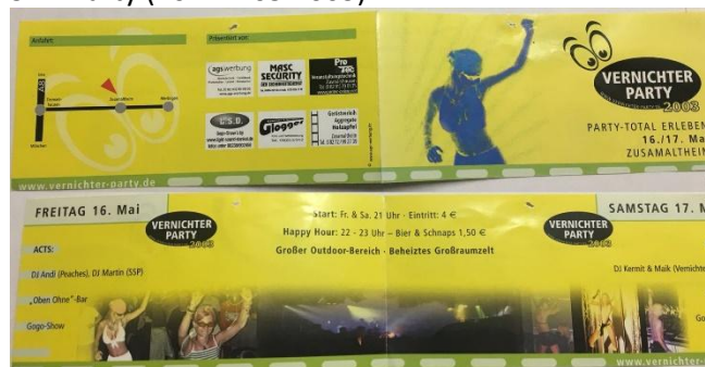
9. V-Party (16.+17.05.2003)