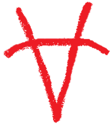
6. V-Party (12.+13.05.2000)